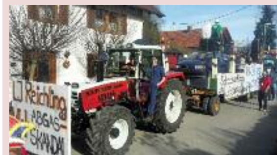
Oben: Eines der ersten Bilder - der Ausflug nach Landau (1956). Mitte: Stolz präsentiert die Landjugend auf dem Wurzburg ihre neue Fahne (2009). Unten: Die Faschingswägen der Landjugend sind inzwischen fester Bestandteil der verschiedenen Umzüge.