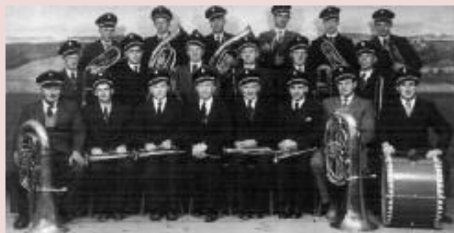
Viele Generationen prägten die Musik in Reichling. Ganz links das erste Bild - vermutlich von 1930, daneben eine Aufnahme von Ostern 1956. Ab 1973 waren auch Mädchen dabei, wie hier das Farbfoto von 1978 zeigt.