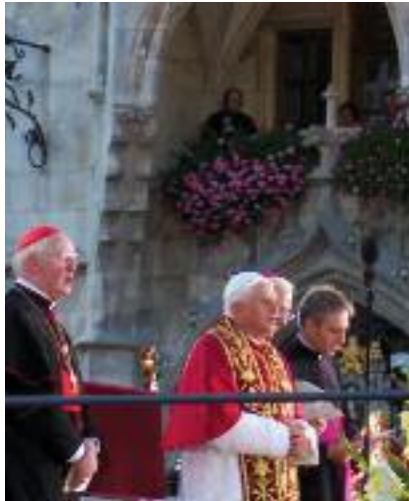
Prominenter Hymnen-Sänger: unser bayerischer Papst Benedikt XVI. auf dem Marienplatz in München am 9. September 2006.

Obwohl es im Königreich Bayern eine offizielle Königshymne gab, wurde „Gott mit dir“ wegen seiner