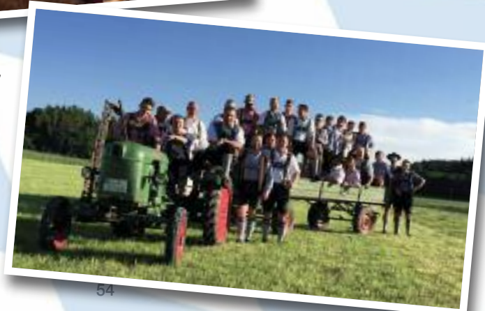
Rechts: Fröhliche Gesichter nach der erfolgreichen Aktion - aber klar doch!